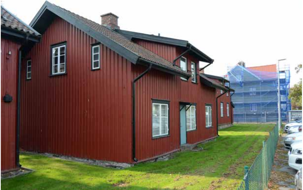
Baksidan har en dörr och ett taklyft som är en senare addering. Även på denna sida är grunden mycket låg. Marknivån når nästan ända upp till panelen.