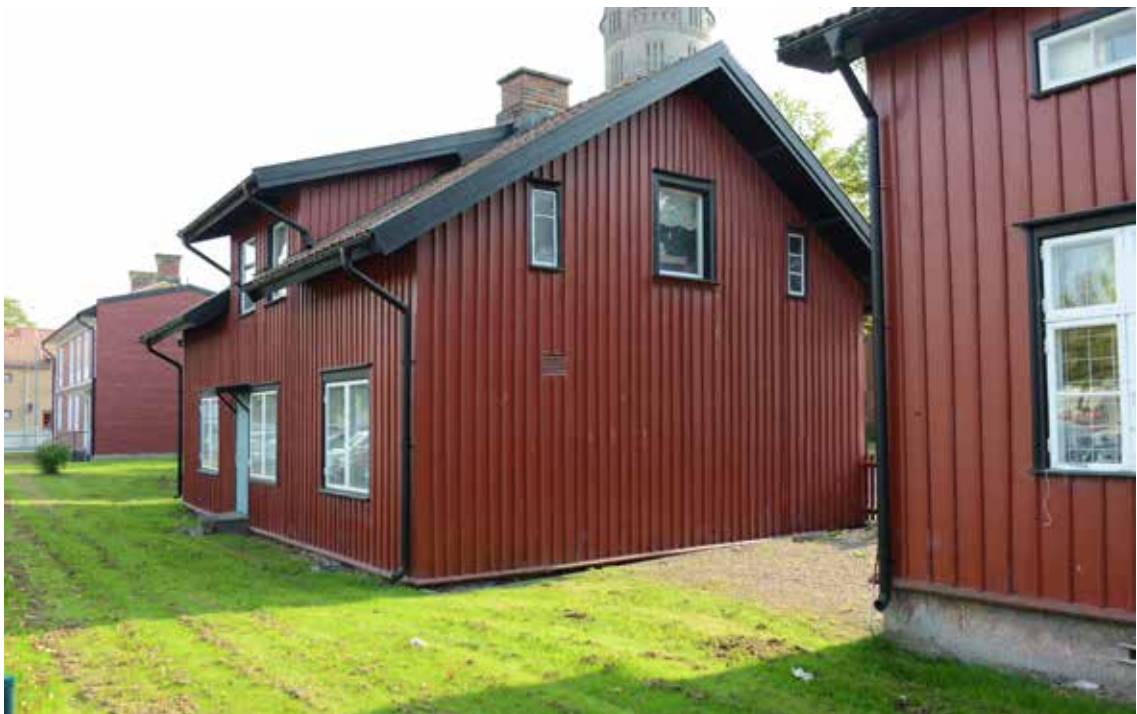
Gavelfönstret på västra sidan är av senare datum.