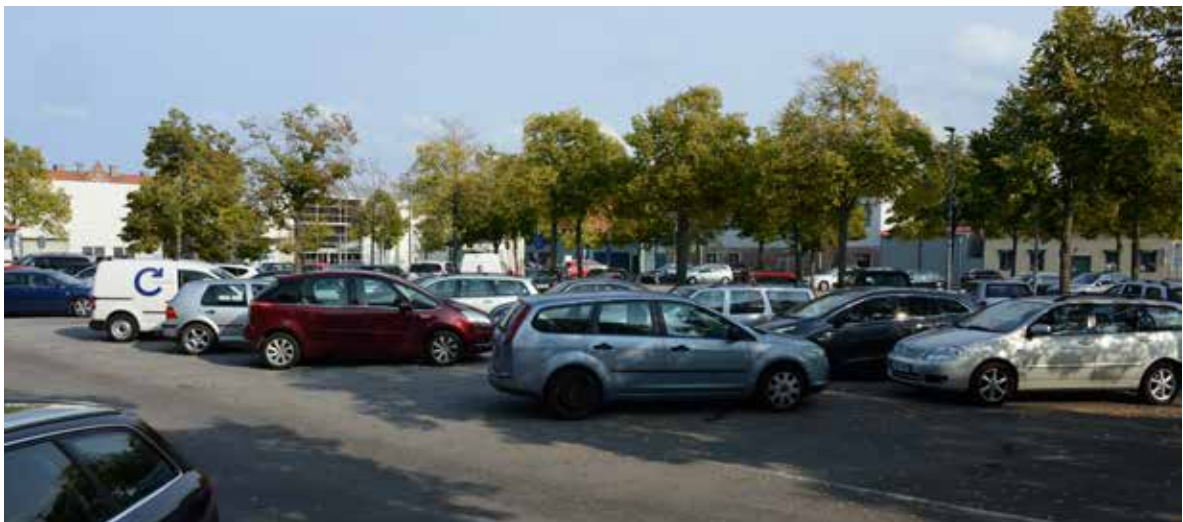
Kvarterens inre domineras helt av de parkeringsytor som inramas med trädplanteringar längs respektive gata.